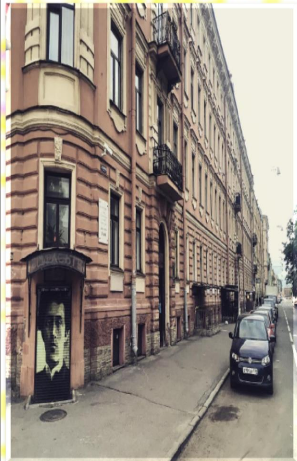
Музей А. Блока