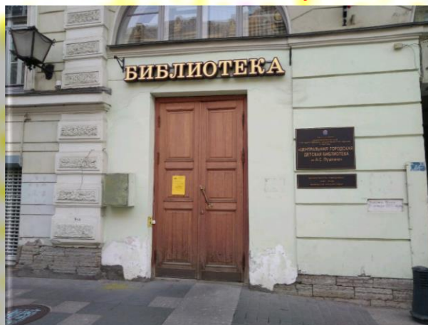
Центральная городская детская библиотека А.С. Пушкина